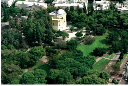
צילום גן העלייה השנייה ומצפה הכוכבים